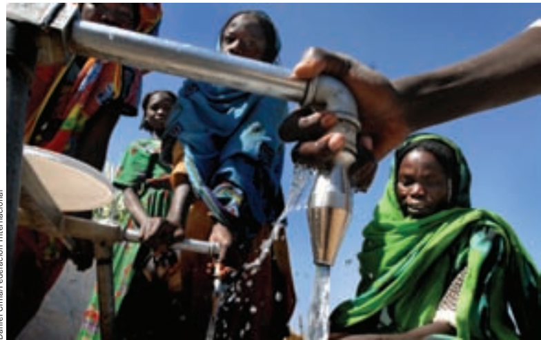
Daniel Cirma/Federación Internacional

Para el ámbito del agua y el saneamiento existen tres módulos distintos en función del volumen de agua requerido, los requisitos en materia de higiene y el número y la localización de los beneficiarios. Su labor se guía